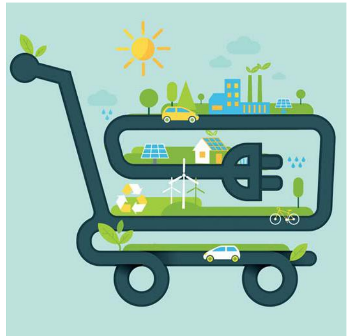
Imagen del Fondo de Sustentabilidad Energética.

Logramos financiar nuestros proyectos en el mercado de capitales. Importantes funciones como la creación de comercializadores independientes, participantes del mercado eléctrico, antes llamados generadores y suministradores calificados, apoyaron a los proyectos eléctricos a asegurar flujos de venta futuros para sus nuevas inversiones y crearon nuestro mercado dinámico actual.